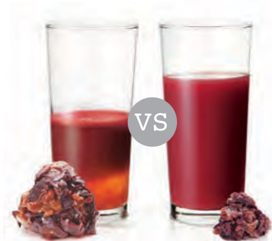
[hagyományos gyümölcsprések] [morejuicepress]