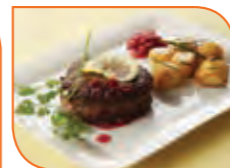
Bélszín gránátalma szósszal