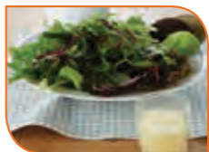
Citromos – gyömbéres salátaöntet