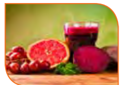
Gyümölcs és zöldség smoothie-k